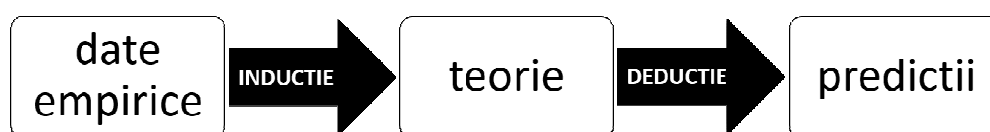
Figura 1-1. Algoritmul luării deciziilor

științific (Figura 1-1). Spre exemplificare, în activitatea practică medicală, deciziile pe care le iau medicii sunt în acord cu predicțiile pe care le fac în baza cunoașterii existente, însușite prin pregătirea lor profesională. Ei recomandă un tratament făcând predicția că prin administrarea lui există șansa cea mai mare de obținere a unui efect pozitiv (de exemplu vindecarea sau oprirea evoluției bolii). Înțelegerea provenienței cunoașterii științifice asociază posibilitatea de utilizare optimă a informațiilor disponibile de către specialiști.