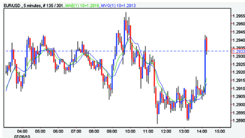
Grafic nr.1 - Evoluția EUR/USD, grafic cu lumânări pe intervale de 5 minute