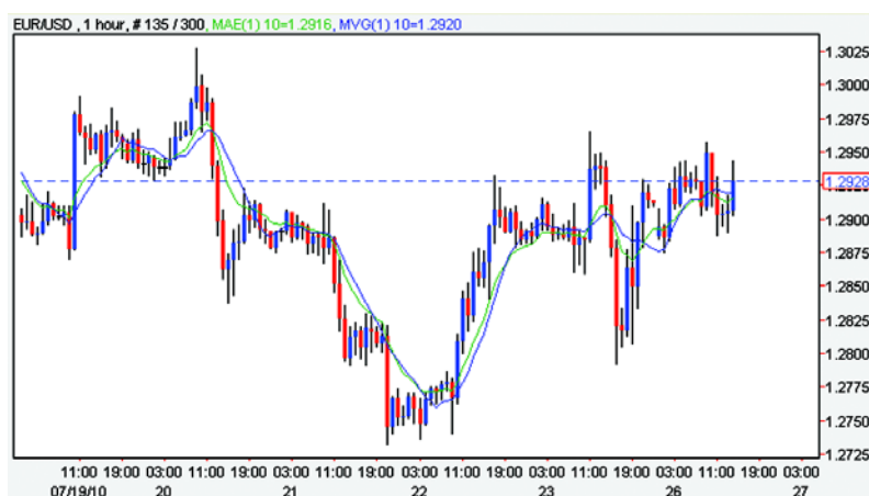
Grafic nr. 2 - Evoluția EUR/USD, grafic cu lumânări pe intervale de o oră