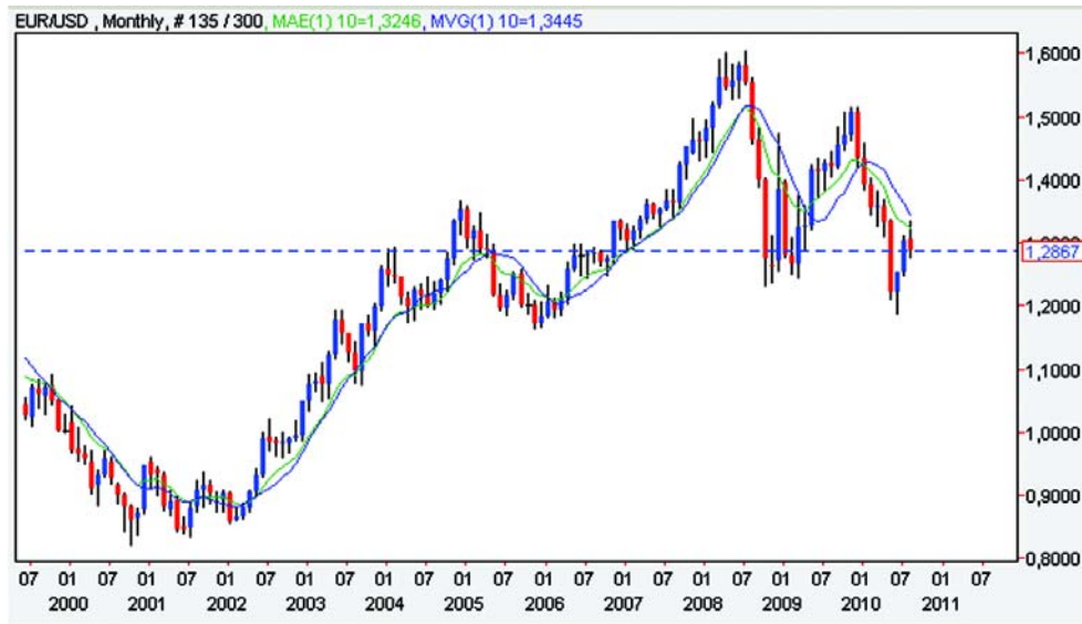
Grafic nr. 3 - Evoluția EUR/USD, prin grafic cu lumânări pe intervale lunare

În cazul cursului de echilibru pe termen lung se observă că există un număr mare de luni sau chiar un an în care cursul nu a intersectat media, ori s-a situat peste ori sub media mobilă (așa cum se observă din debutul anului 2007 până la jumătatea anului 2008, graficul 3).